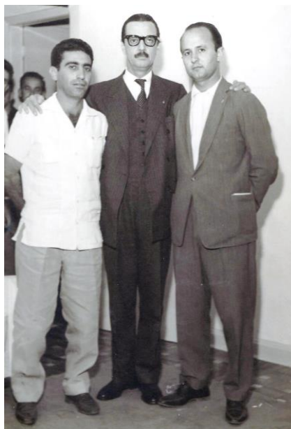
Com o presidente Jânio Quadros, do tempo em que foi vereador em José Bonifácio (SP) – 1961

Sua família tinha longa e tradicional história política na cidade. Foi eleito vereador e presidente da câmara - o mais bem votado da história de José Bonifácio até hoje - mas renunciou e entregou o mandato logo na primeira sessão da câmara por não concordar com os meandros do poder. Resolveu, então, abrir seus próprios caminhos e mudou-se com a família para Palmeira d'Oeste, que necessitava de médicos, em 1967.