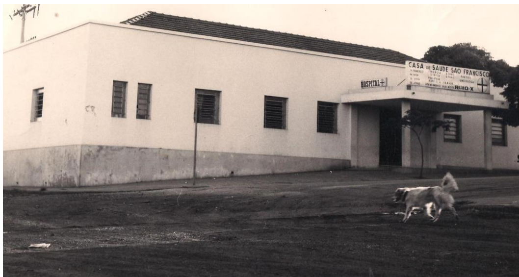
Hospital São Francisco - 1970