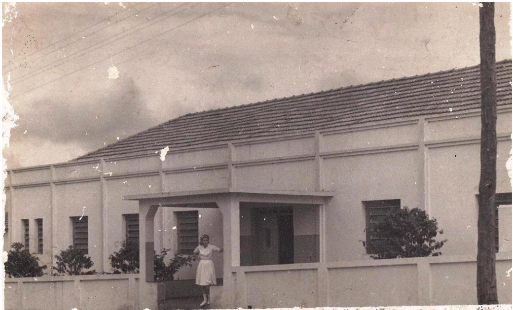
Hospital São Francisco – 1967