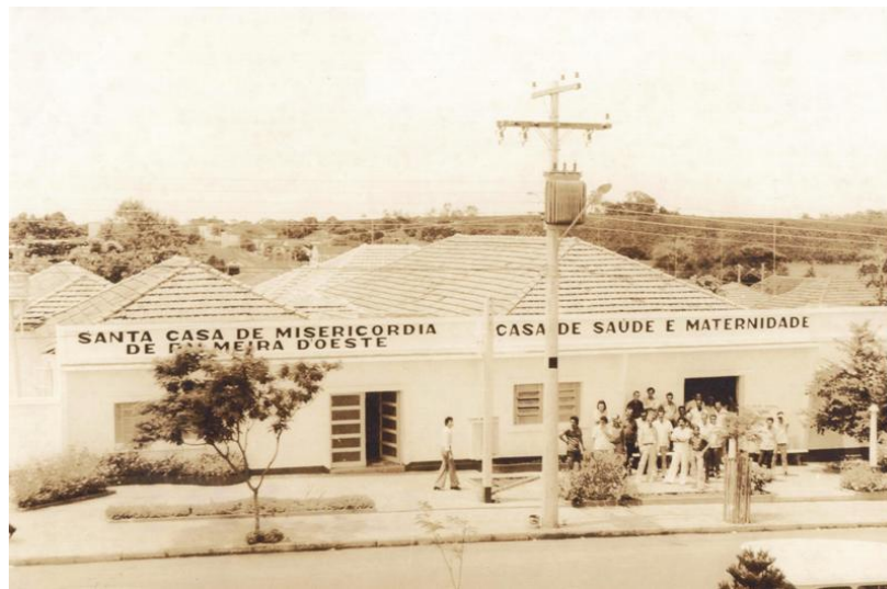
1965 – Inauguração da Santa Casa de Misericórdia de Palmeira d'Oeste

No Centro de Saúde também foi seu primeiro médico. Foi o seu Médico Chefe desde o início, só encerrando suas atividades por ocasião da sua aposentadoria. Implantou e executou vários e importantes programas de saúde ao longo de sua carreira.