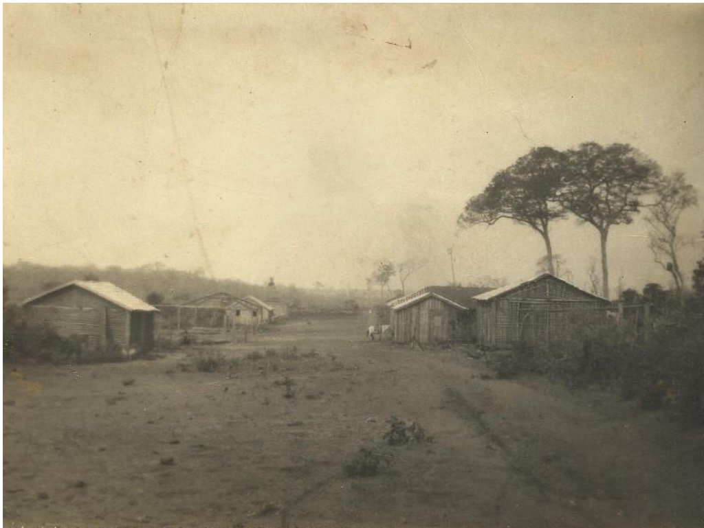
Palmeira d'Oeste (SP) – Início da formação do vilarejo em 1943 – As primeiras edificações - Este espaço entre as duas pequenas fileiras de casas de pau-a-pique veio a ser a primeira via pública da vila e foi denominada: Avenida Marechal Cândido Rondon (nome alterado para Antônio Fernandes Garcia) localizada entre os cruzamentos da Rua Brasil e Rua São Paulo (nome alterado para Marechal Humberto de Alencar Castelo Branco). Ao fazerem a limpeza da área, preservaram dois majestosos Jatobazeiros.