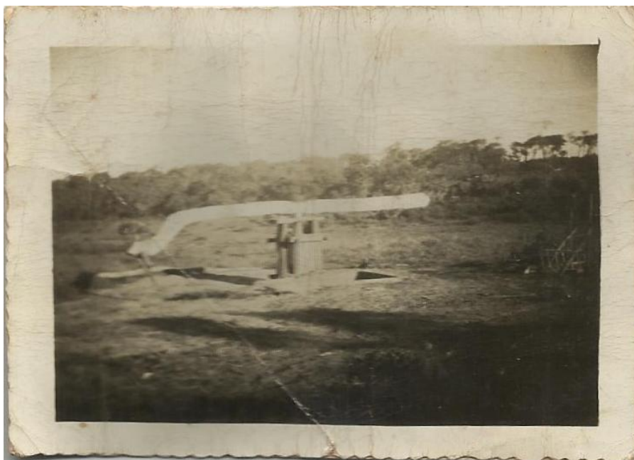
Pipa da primeira Olaria de Palmeira d Oeste- A Pipa era usada para “bater” o barro no processo de fabricação de telhas e tijolos – A pipa era movida por um animal que caminhava em círculos atrelado à Pipa – A pessoa que abastecia a Pipa era chamada de “Pipeiro” - 1943