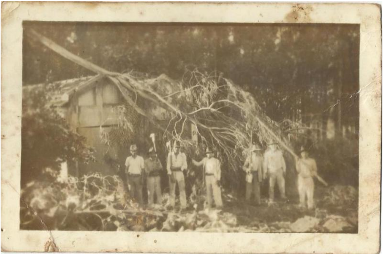
Casa da família de José Vicente Vicente depois de um forte temporal .