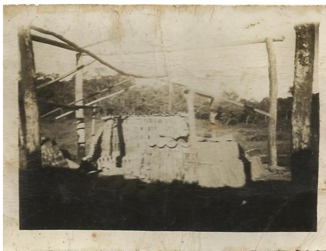
Primeira Olaria de Palmeira d Oeste com um lote de telhas prontas para uso – 1943