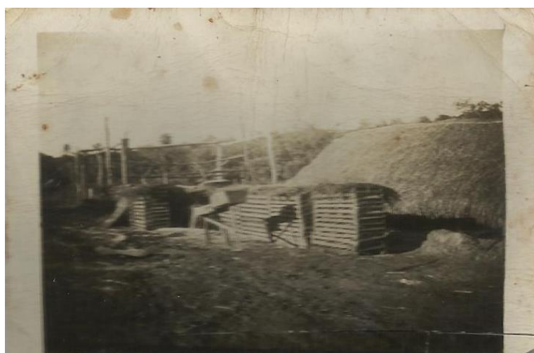
Primeira Olaria de Palmeira d Oeste – Localizada numa área entre a Rua Brasil e Rua Marechal Humberto de Alencar Castelo Branco (antes. chamada de Rua São Paulo) – Onde hoje se localiza a Igreja da Congregação Cristã no Brasil e vizinhança - 1943