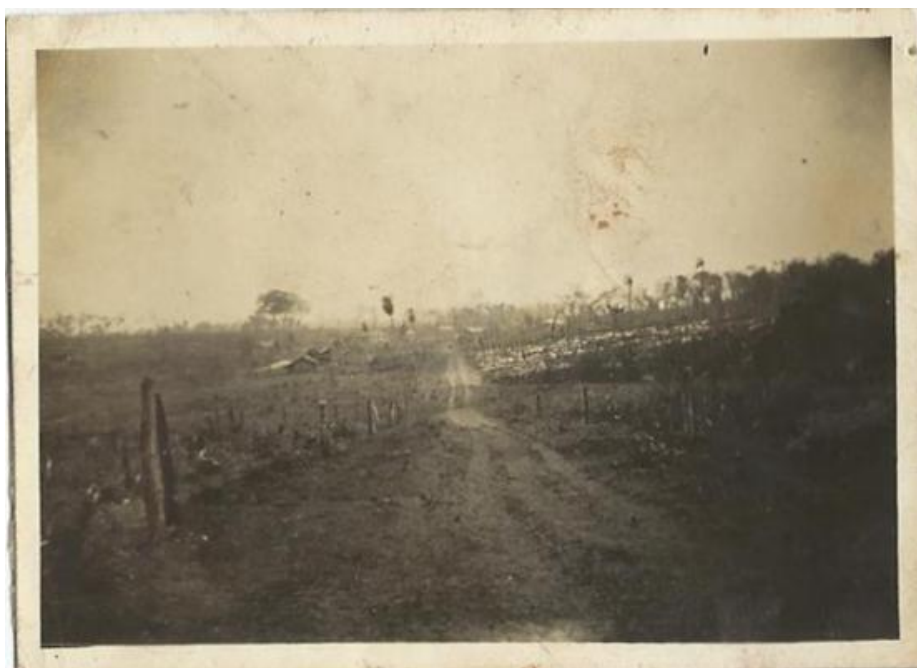
Palmeira d'Oeste - 1943