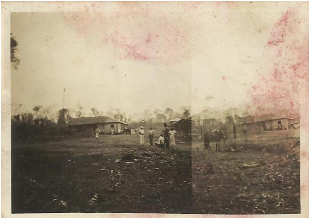
Mesmo local da foto anterior, no ângulo oposto, com os primeiros moradores - 1943