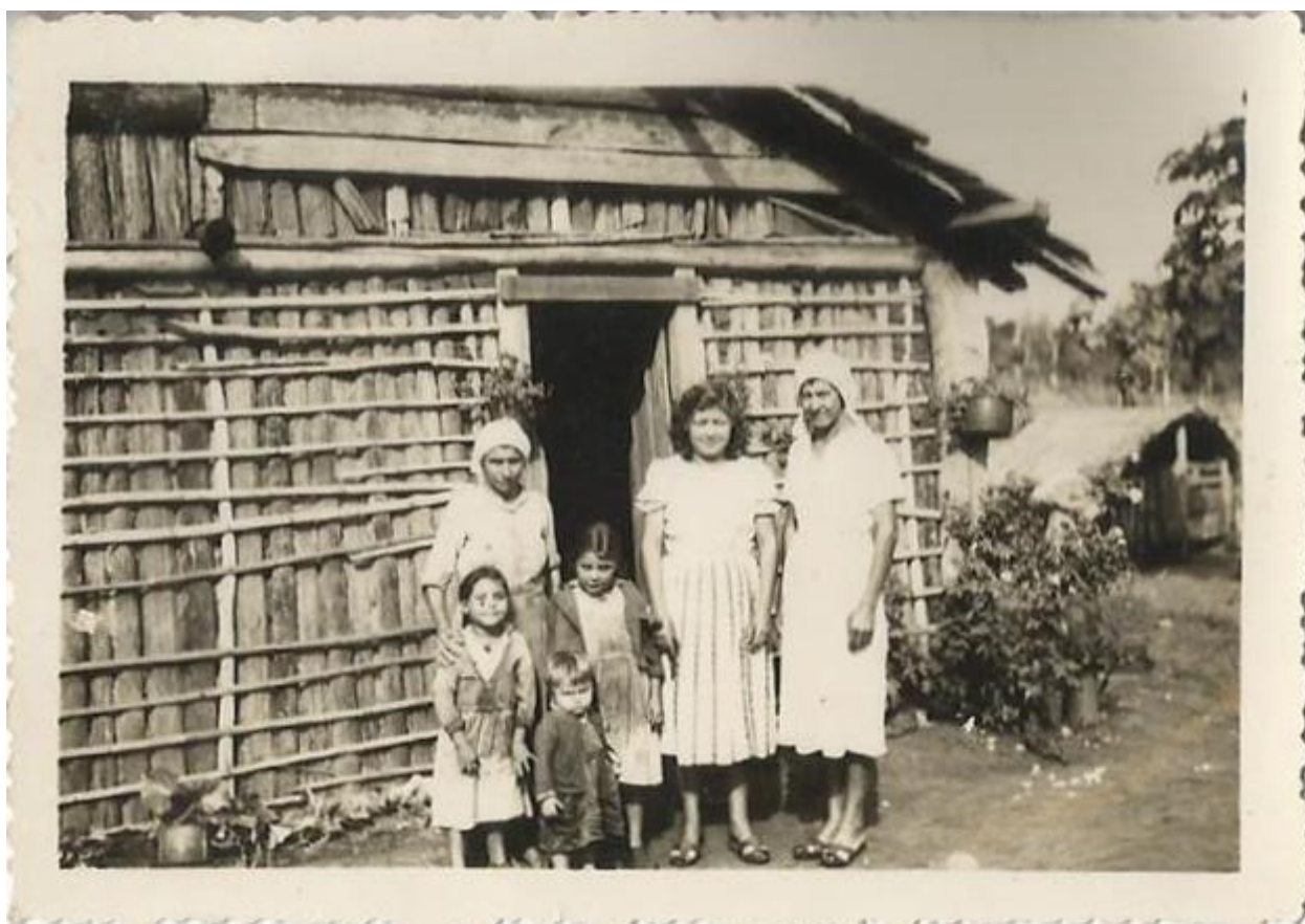
Palmeira d' oeste – 1943