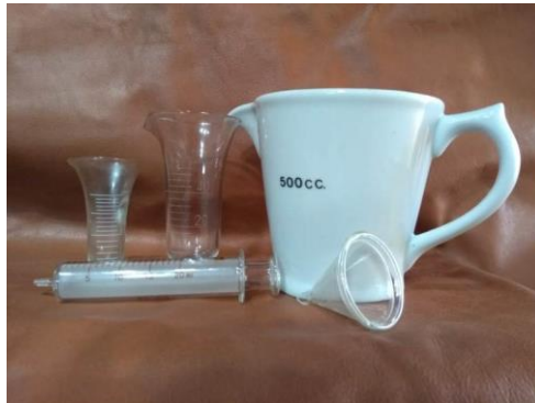
Utensílios antigos de farmácia – seringa de vidro e vários medidores de volume