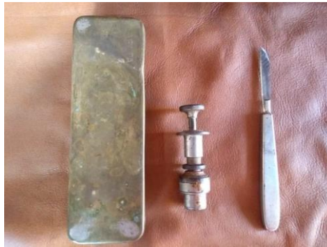
Utensílios antigos de farmácia - Caixa metálica, encapsulador e bisturi de lâmina fixa